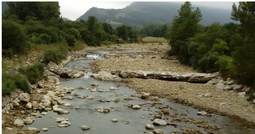
Estado actual del cauce del río Saja

Con estas intervenciones se persigue recuperar el hábitat de las diferentes especies propias de los ecosistemas fluviales (hábitat de la avifauna, de los anfibios y de los fitófagos de la madera) que, junto con la creación de una red de islas de hábitat, aumentará incluso la diversificación del medio y de las especies que dependen de ello.