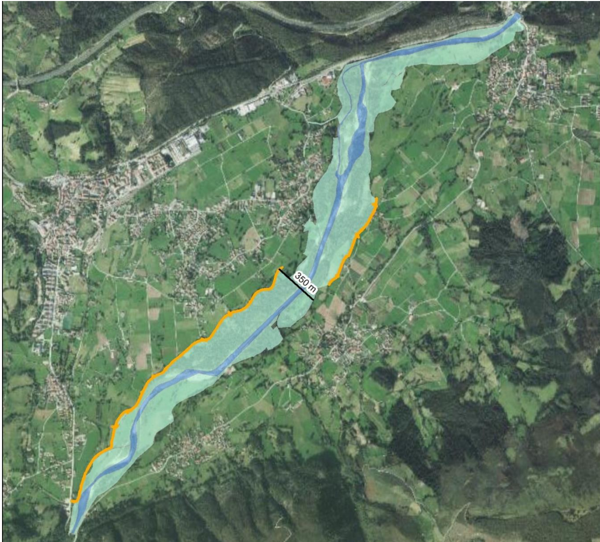
Espacio fluvial público delimitado

Más información en la Plataforma de Contratación del Sector Público: